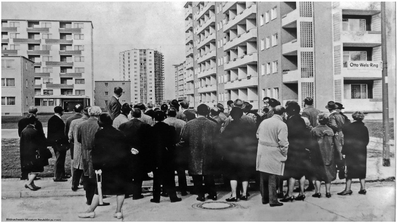
Bildnachweis: Museum Neukölln, no. 11977