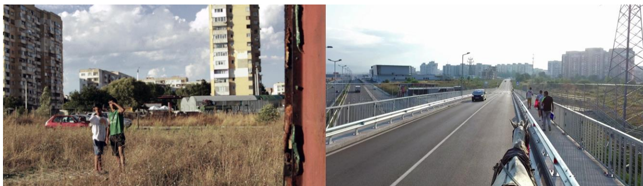
Кадри от видео, Красимир Терзиев / Даниел Къотер, Периферна светлина въздух и слънце, 2016 , четириканална видео инсталация, текст, фотографии